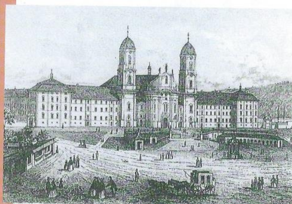
Das Kloster Maria Einsiedeln nach einem Stahlstich der Gebrüder Benzinger um 1862.